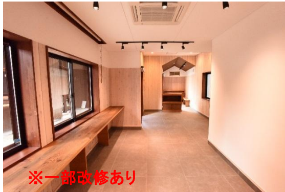
インフォメーション棟 1F