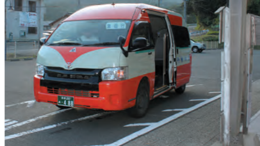
バリアとなる高いステップ

答 伊根バスのステップは標準を大きく上回っており、利用者からも「段差をなくすため昇降台を置いてほしい」などの声を伺っている。平成26年に伊根バスを更新する際、低床車