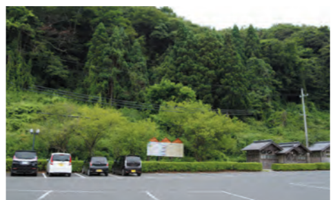
ホテル建設予定地