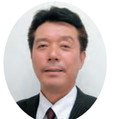
上辻 亨 議員