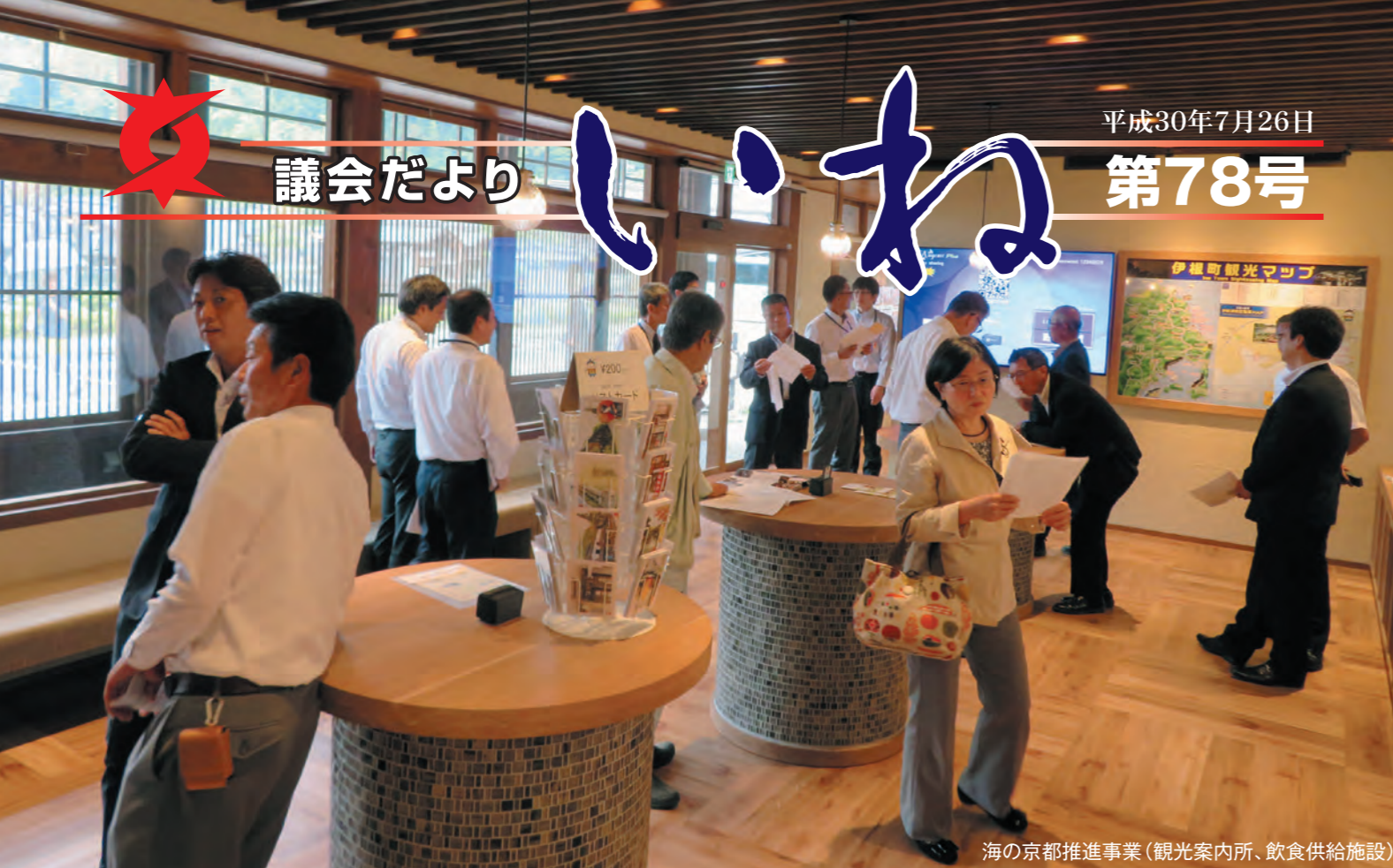
海の京都推進事業（観光案内所、飲食供給施設）