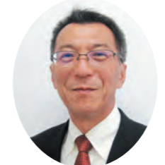
大谷 功 議員