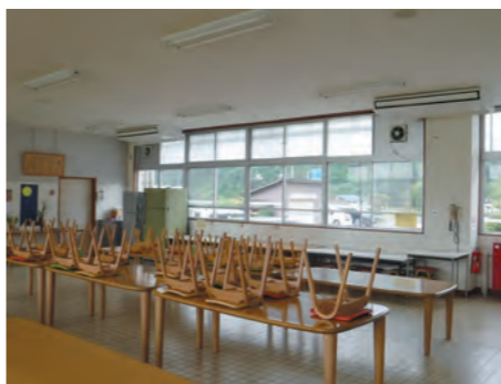
エアコン設置を待つ小学校

【問】 除雪により庁舎駐車場内のフェンスが破損したとのことだが、除雪は業者に委託しているのか。