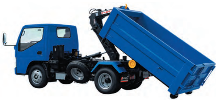
新しくなるゴミ収集車

【答】 あくまでも設計価格ですが、車両が600万円超、コンテナ脱着装置200万円超、コンテナについては60〜70万円です。