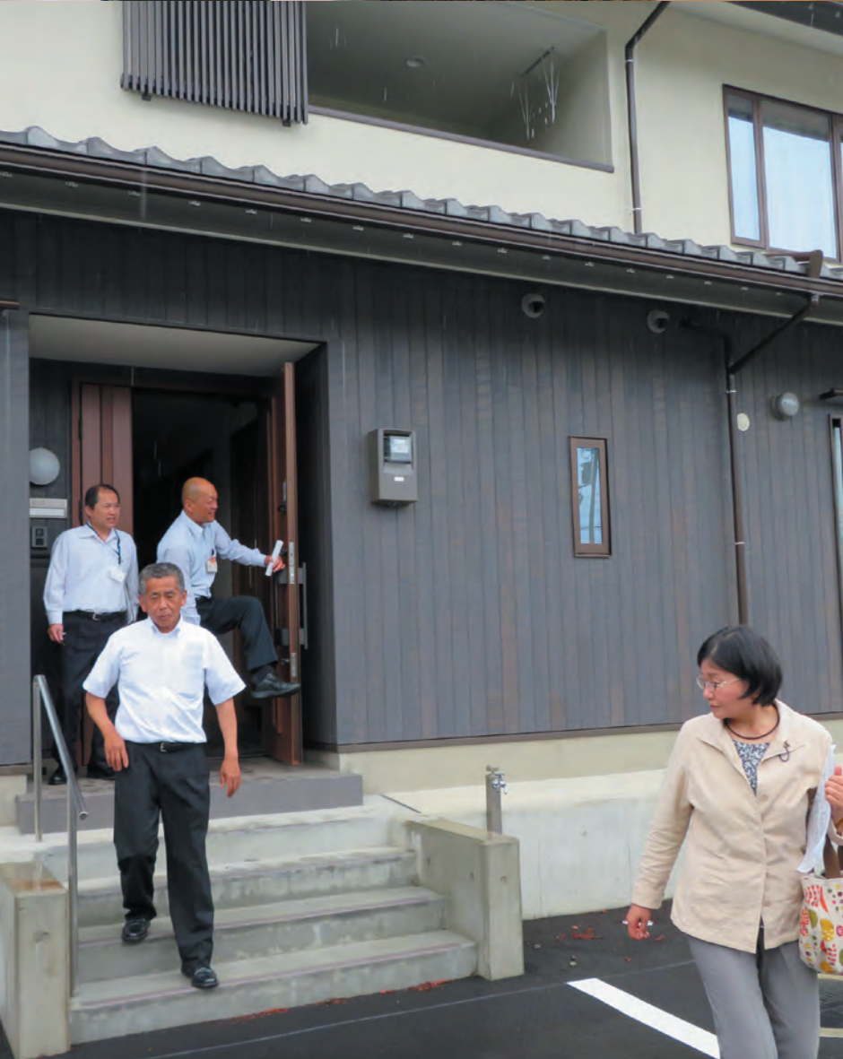
定住化促進住宅大原団地