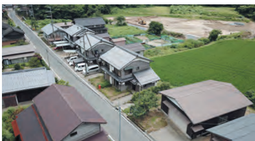
現在も空きのある筒川町営住宅群

答 植栽の管理は年1回シルバー人材センターに委託している。その他は各団地で行っている。掃除